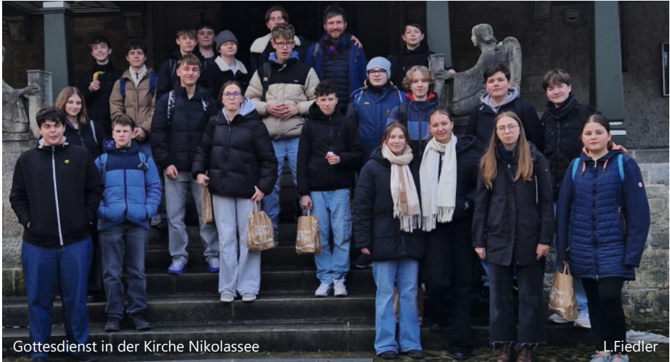
Gottesdienst in der Kirche Nikolassee